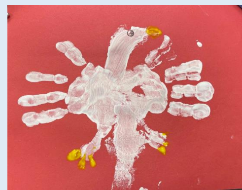
Godło polski – praca plastyczna jednego z naszych uczniów Klasy 2 z poprzedniego roku.